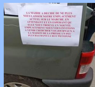
Figure familière du marché de Fécamp depuis 2006, la marchande de journaux vient de voir son emplacement supprimé par le maire de Fécamp. Drôle de manière de venir en aide au petit commerce local